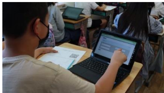
1人1台端末を活用し受検