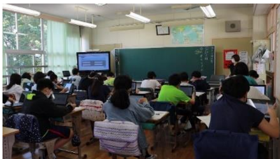
池袋小学校での実施様子

TOFAS は一般申込みのみならず、日本の小学校や中学校といった公教育の場でも導入が進んでいます。GIGA スクール構想による 1 人 1 台端末の整備が進んだ学校現場において、従来の紙のテストに代わる CBT（Computer Based Testing）方式のテストとして TOFAS が活用されています。東京都港区・豊島区、新潟県長岡市などからは、作問や採点において教員の負荷軽減につながるなど、細かい分析による可視化で授業改善の指標にできることなど、指導側のメリットが大きいとの声を頂戴しています。