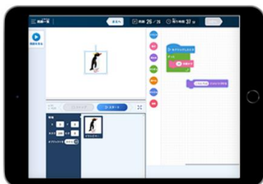
検定画面イメージ