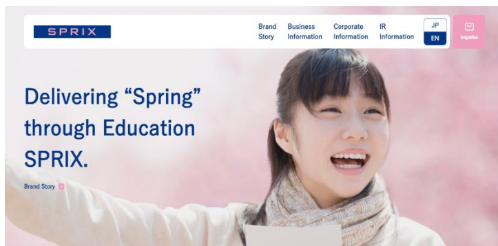
新コーポレートウェブサイト英語版