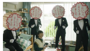
オンライン個別指導塾「そら塾」