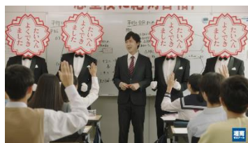
集団学習塾「湘南ゼミナール」